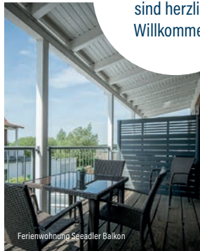
Ferienwohnung Seeadler Balkon