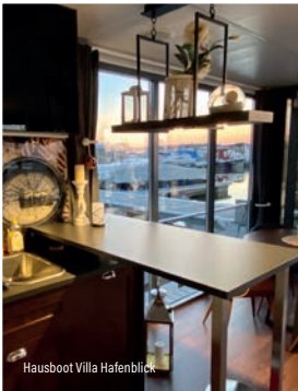
Hausboot Villa Hafendblick

Auch Eure 4-BEINER sind herzlich Willkommen!