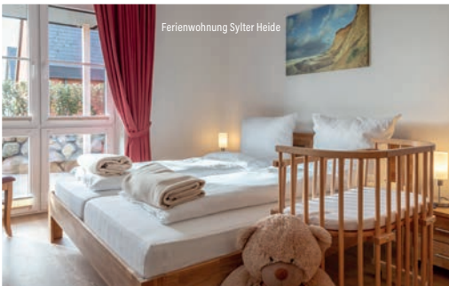
Ferienwohnung Sylter Heide