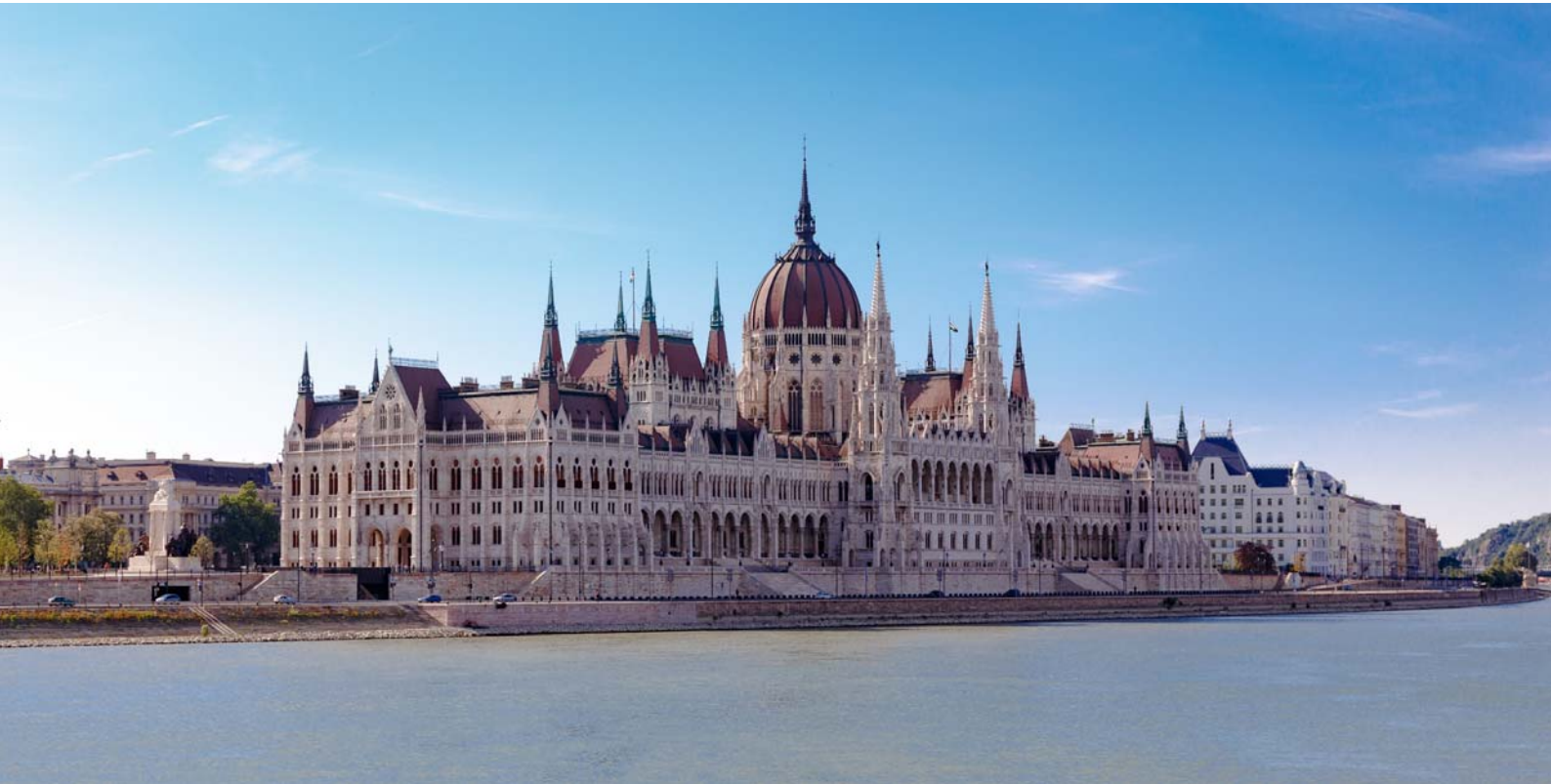
Budapest - Parlament

Im Jahr 1992 gebaut, kreuzte die MS Princesse de Provence auf den Flüssen Rhone und Saone in Frankreich. Nach einer aufwendigen Überführungstour durch Mittelmeer, Atlantik und Nordsee ist sie nach einer gründlichen Überholung auf einer österreichischen Werft seit April 2018 auf der Donau unterwegs. Das Schiff der gehobenen Mittelklasse verfügt über 74 Außenkabinen, 31 davon mit französischem Balkon. Das weitläufige Sonnendeck ist mit Sitzgruppen, Liegestühlen und schattenspendenden Sonnensegeln ausgestattet.