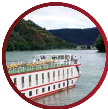
Princesse de Provence