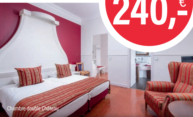
Chambre double Château

Pour la St Valentin, offrez-vous un moment d'intimité et de romance dans notre château, dans un cadre idyllique. Rien de plus enchanteur que de passer une nuit dans un somptueux château du 19e siècle, niché au cœur d'un parc verdoyant. Pour rendre votre expérience encore plus mémorable, nous vous réservons un accueil empreint de romantisme dès votre arrivée. Profitez d'une nuitée dans l'une de nos chambres, suivi d'un dîner d'exception dans notre restaurant "Le Festival".