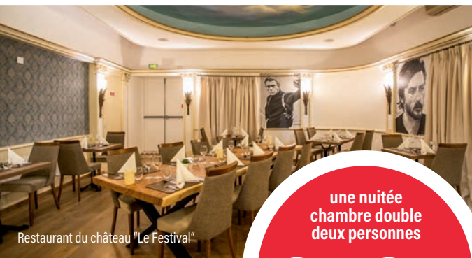
Restaurant du château "Le Festival"

une nuitée chambre double deux personnes