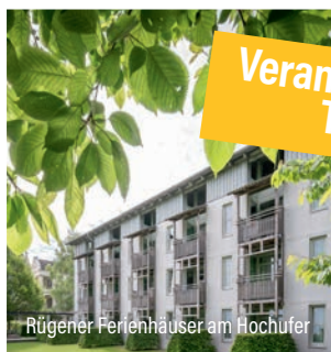
Rügener Ferienhäuser am Hochufer