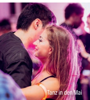
Tanz in den Mai