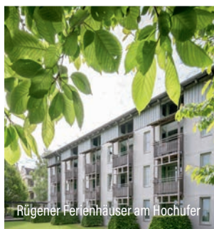
Rügener Ferienhäuser am Hochufer