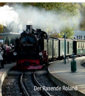
Der Rasende Roland