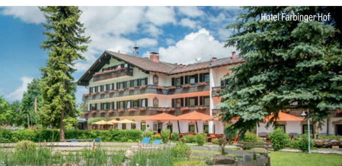
Hotel Farbinger Hof